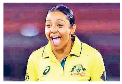
वनडे में अलाना का जलवा फिर बनी नंबर वन गेंदबाज