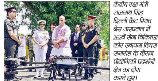
केंद्रीय रक्षा मंत्री राजनाथ सिंह दिल्ली कैम्प स्थित बेस अस्पताल में 26वें सेना चिकित्सा कोर शरणागता दिवस समारोह के दौरान प्रौद्योगिकी प्रदर्शनी क्षेत्र का दौरा करते हुए।

राजनाथ सिंह ने कहा कि देश का रक्षा मंत्री होने के नाते वह खुद इस मुद्दे पर अपनी बात रख रहे हैं और यह जरूरी नहीं कि हर बात पर प्रधानमंत्री ही बोलें। रक्षा मंत्री ने स्पष्ट किया कि भारत की सुरक्षा और रक्षा मामलों पर सरकार की नीति पूरी तरह स्पष्ट है। राजनाथ सिंह ने दोहरे शब्दों में कहा कि वह देश के रक्षा मंत्री हैं और रक्षा से जुड़े विषयों पर बोलने के लिए पूरी तरह अधिकृत हैं।