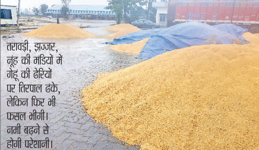
तरावड़ी, झज्जर, नूंह की मंडियों में गेहूं की ढेरियों पर तिरपाल ढंके, लेकिन फिर भी फसल मीगी। नमी बढ़ने से होगी परेशानी।