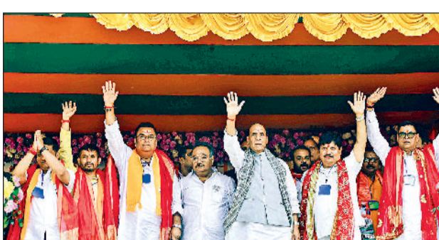
रक्षा मंत्री राजनाथ सिंह पश्चिम बंगाल की उत्तरी 24 परगना जिले के बैरकपुर में एक जनसभा के दौरान