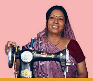
हम 10+ करोड़ महिलाएं 90+ लाख SHGs से जुड़कर ही रहीं आत्मनिर्भर