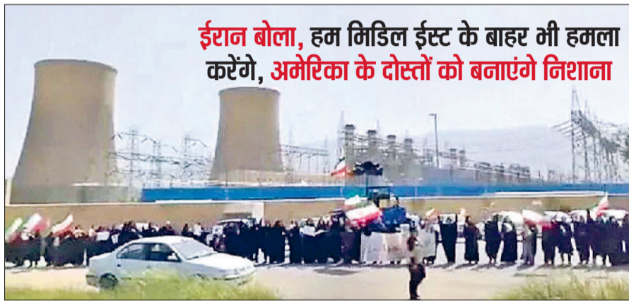
ईरान बोला, हम मिडिल ईस्ट के बाहर भी हमला करेंगे, अमेरिका के दोस्तों को बनाएंगे निशाना

तेल अवीव/ वॉशिंगटन (एजेसी)। अमेरिकी राष्ट्रपति डोनाल्ड ट्रंप ने मंगलवार को ईरान को कड़ी चेतावनी देते हुए ट्विटर सोशल पर कहा आज रात एक पूरी सभ्यता खत्म हो जाएगी, जिसे फिर कभी वापस नहीं लाया जा सकेगा। उन्होंने कहा कि मैं नहीं चाहता कि ऐसा हो, लेकिन शायद ऐसा ही होगा। हालांकि, अब वहां सत्ता पूरी तरह बदल चुकी है, जहां अलग, ज्यादा समझदार और कम कट्टर सोच वाले लोग मौजूद हैं। कौन जानता है कि शायद कुछ बहुत शानदार और क्रांतिकारी हो सकता है? ट्रंप ने दावा किया कि आज रात हम दुनिया के लंबे और जटिल इतिहास के सबसे अहम पल के गवाह बनेंगे। 47 सालों की ज्यादाती, भ्रष्टाचार और मौत का सिलसिला आखिरकार खत्म हो जाएगा। ईश्वर ईरान के लोगों की रक्षा करें।