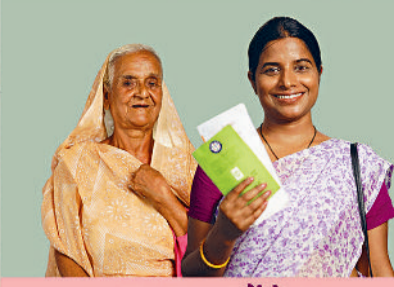
जन धन खातों से हम 32+ करोड़ महिलाएं सशक्त